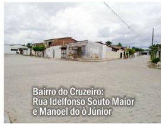
Bairro do Cruzeiro: Rua Idelfonso Souto Maior e Manoel do Júnior