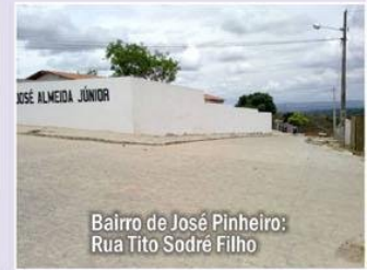
Bairro de José Pinheiro: Rua Tito Sodré Filho