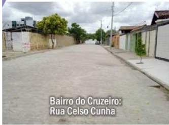
Bairro do Cruzeiro: Rua Celso Cunha